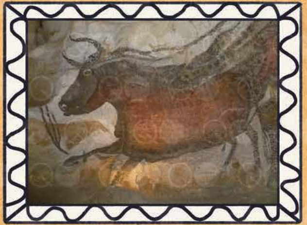
AQUEST BISÓ PREHISTÒRIC, QUE TÉ UNS 20.000 ANYS, ÉS UNA DE LES MOLTES PINTURES DE LASCAUX, FRANÇA

Com que les persones que vivien a la prehistòria no van escriure res del seu art, és complicat esbrinar per què van crear aquelles obres a l'interior de coves que no habitava ningú. Les imatges de segur que estaven relacionades amb la religió o la màgia. És possible que les persones fessin art per protegir-se del perill, per tenir bones caceres o per celebrar el naixement dels nadons.