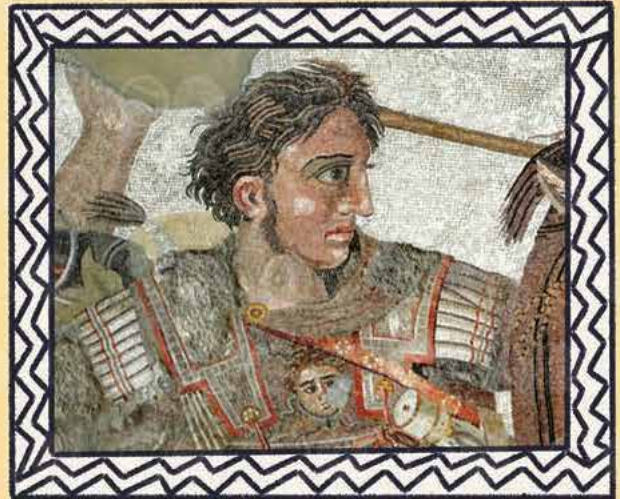
EL MOSAIC D'ALEXANDRE, DEL SEGLE II AC, FET DE PECES DIMINUTES DE VIDRE ANOMENADES «TESSEL·LES»

Un dels centres culturals clau de l'antiguitat era Grècia, que va produir edificis, pintures, escultures i ceràmica. Al llarg dels anys, els artistes grecs van aprendre molt sobre l'anatomia i el moviment i el seu art es va tornar molt més vívid i realista. Pels volts del 753 a. C., es va fundar l'antiga Roma. Inlluïts per la cultura grega, els romans van desenvolupar una arquitectura i un art majestuós per honrar les deïtats o per mostrar l'estatus i el poder de l'Imperi romà.